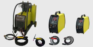
TIG AC/DC (Inverter)